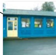
Derrière la mairie