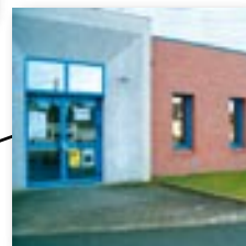
Dans la salle omnisports