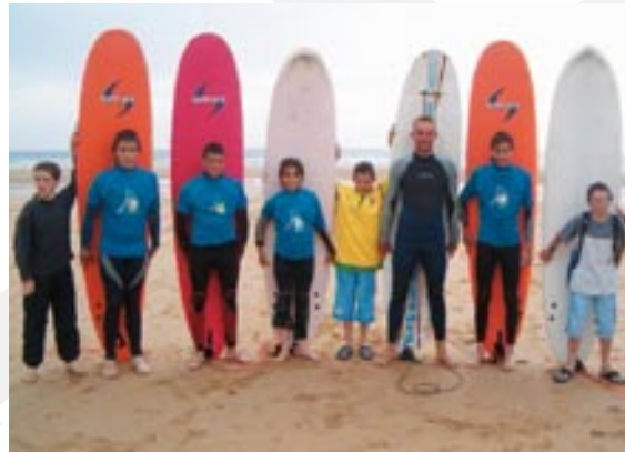
Camp surf, été 2005

Dans le cadre de l'opération Ciné Ville, la Communauté des Communes dispose de bons de réduction pour les jeunes de moins de 25 ans donnant accès à moindre coût au cinéma Les Baladins (distribution de mars à décembre en fonction du stock disponible).