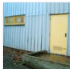
Derrière la salle polyvalente