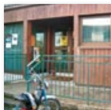
Place du bourg