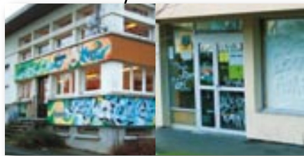
Le Central 3 av. Kennedy