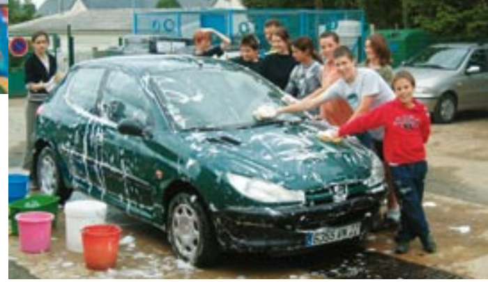
Autofinancement d'un séjour multisport