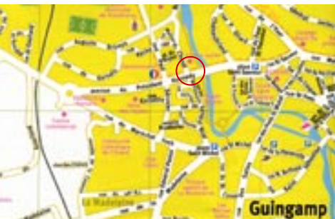
Plan d'accès au local central

Et bien entendu, si vous le souhaitez : vos projets!!!