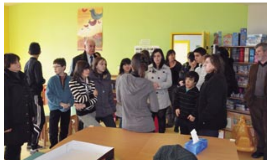
Maison de l'enfance