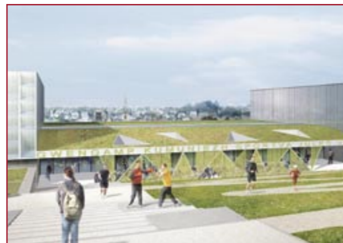
Gymnase Jules Verne