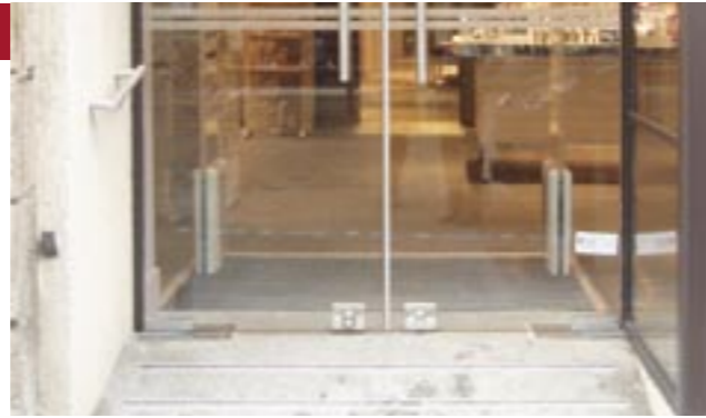
Construction d'une rampe et d'une poignée pour faciliter l'accès aux personnes handicapées (magasin Yves Rocher, Guingamp)